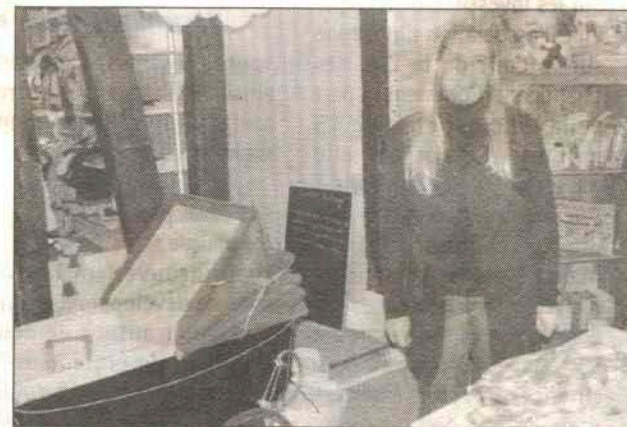
"Loulou Pistache", une superbe penderie pour les tout-petits, créée par Vanessa Duhomme.